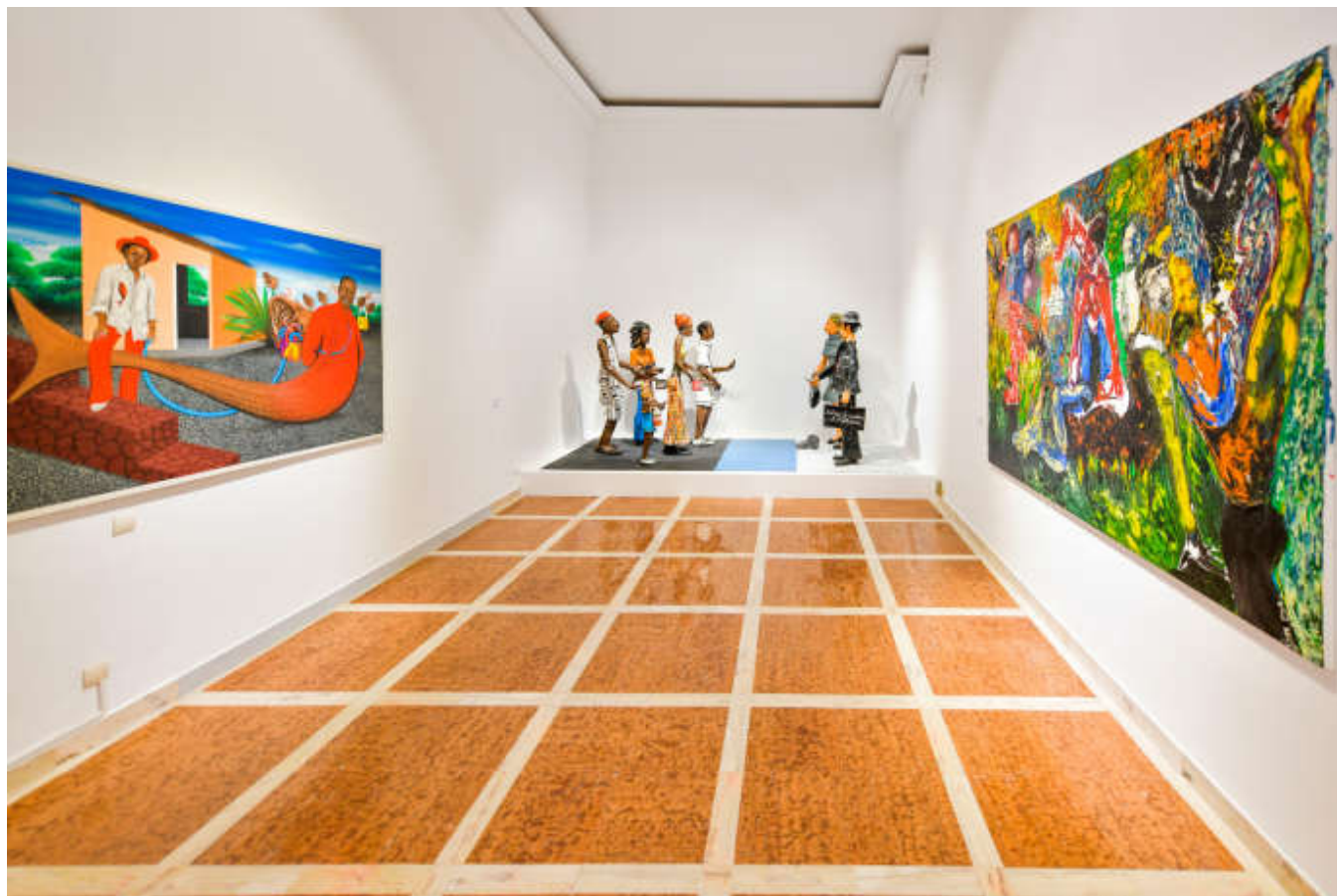
L'exposition « Prête-moi ton rêve » à laquelle ont participé 28 artistes africains, à Casablanca, au Maroc, en juin 2019.